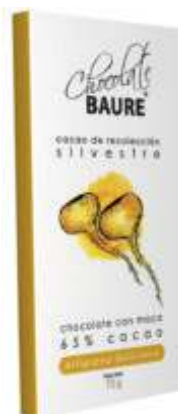
Chocolate con maca 65% cacao silvestre