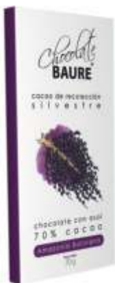
Chocolate con asaí 70% cacao silvestre