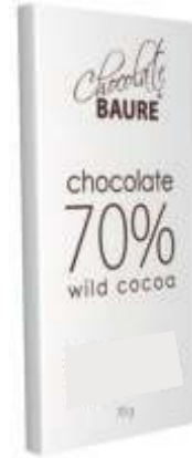
Chocolate 70% cacao silvestre