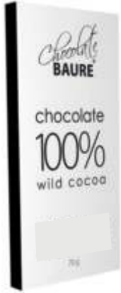
Chocolate 100% cacao silvestre