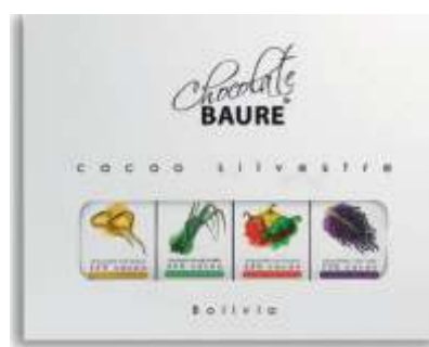
Chocolate colección Bolivia Set de Chocolates