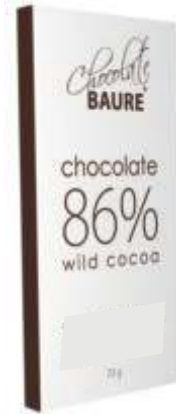
Chocolate 86% cacao silvestre