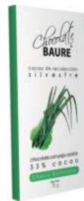
Chocolate con paja cedrón 55% cacao silvestre