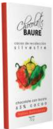
Chocolate con locoto 65% cacao silvestre